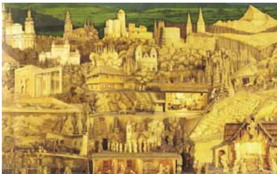
Betlehem v Rajeckej Lesnej

Rajecký betlehem môžeme považovať za učebnicu dejepisu i zemepisu, zrkadlo umu a umenia rezbárskych tradícií v Rajci. Dýcha z neho optimizmus, radosť z práce i zo života, všedný i sviatočný deň prostého človeka. Dielo je dlhé 8,5 metra, široké 2,5 metra a 3 metre vysoké. Spolu je tu rozmiestnených