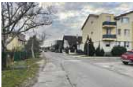
Príjazdna ulica – príprava bezpečnejšej ulice s novými chodníkmi a osvetlením