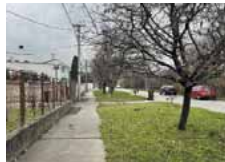
Riešenie dopravnej situácie – zlepšenie stavu ciest a chodníkov v mestskej časti, nové VZN o rozkopávkach