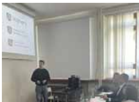
Plánujeme naďalej rozvíjať spoluprácu s univerzitami – STU, Univerzita tretieho veku