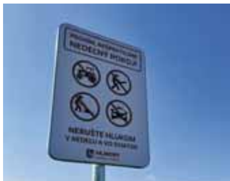
Verejné priestory – vo Vajnoroch pribúda neustále nová zeleň. Pribudli aj informačné tabule na vstupe do Vajnor