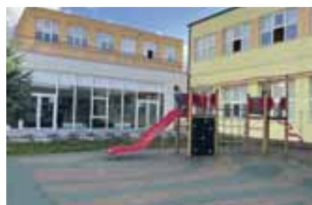
Bezpečná škola – mesto pre deti