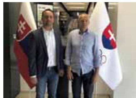
Spoločne so zástupcami hlavného mesta riešime problémy obyvateľov Rybníchej ulice