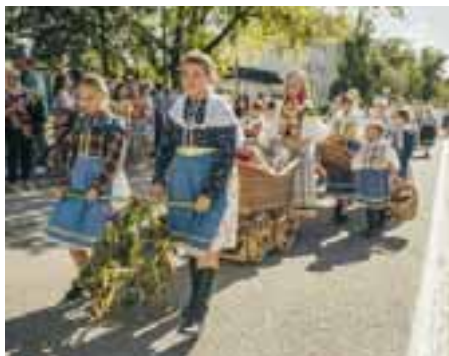
Nadalej budeme podporovať a rozvíjať kultúrne akcie