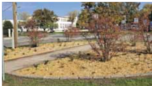
Spustili sme participatívny rozpočet podľa nových pravidiel