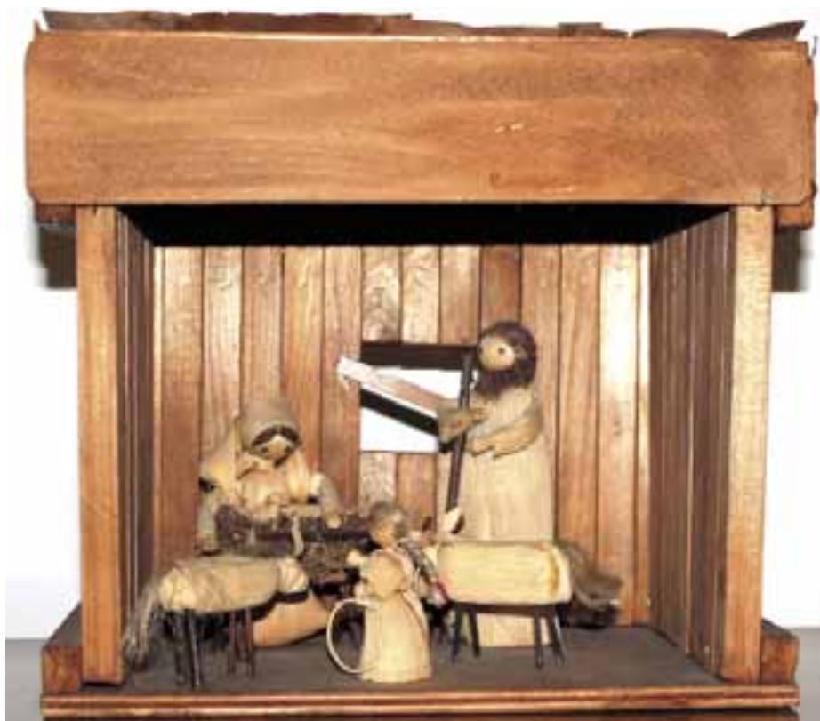
Vlastnoručne vyrobený betlehem pre malú dcéru.

Počas Vianoc ožívajú u nás ľudové tradície viac ako inokedy. S nimi sa spája aj uctievanie betlehemov približujúcich narodenie nášho Pána a potvrdzujúcich bohatosť ich tradície. Tá sa datuje do obdobia trinásteho storočia, keď zakladateľ rehole Františkánov svätý František z talianskeho Assisi v roku 1223 vložil do jednoduchých jasličiek v jaskyni pri mestečku Greccio živé dieťa ako pripomienku narodenia malého Ježiška. Bol to vlastne prvý betlehem a navyše živý, lebo prítomné v ňom boli postavy Márie, Jozefa v spoločnosti zvierat. Navyše František, v tom čase ešte nie svätý, zároveň v jaskyni odslúžil aj vianočnú omšu. Týmto nezvyčajným gestom si chcel nielen uctiť a pripomenúť narodenie Spasiteľa, ale upriamiť pozornosť aj na vtedajšiu chudobu obyčajných ľudí a poukázať, že Spasiteľ prišiel na svet tiež v takých podmienkach. Z tejto iniciatívy vzniká aj tradícia obdarovávania, čo pripomínalo božiu štedrosť lásky medzi ľuďmi.