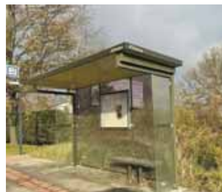
Zachovanie kvality dopravnej obsluhy Vajnor napriek škrtom v DPB a modernizácia zastávok MHD