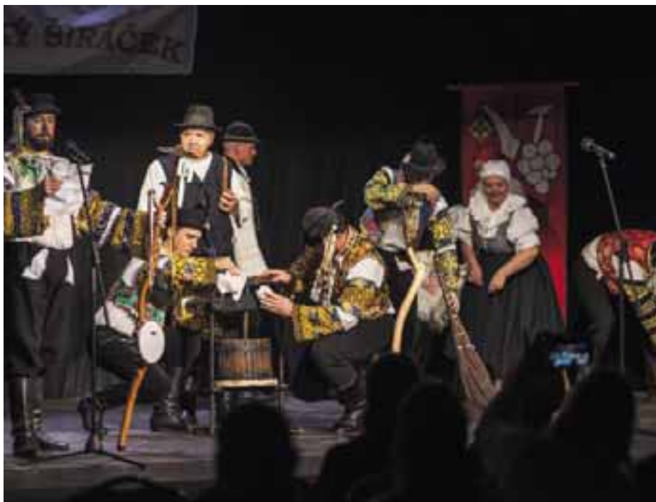
FK Mladosť zo Šenkvic

Jesenný novembrový víkend 16. a 17. novembra patril už tradične podujatiu Vajnorský širáčok, ktorý je organizovaný občianskym združením Podobenka z Vajnor. Tento rok sa konal už 9. ročník a opäť krásny, zaujímavý a plný hodnotných vystúpení. Priestor Domu kultúry Vajnory sa rukami šikovných členov Podobenky a ochotných dobrovoľníkov zmenil na malú veselú oázu krásneho folklóru, umeleckých výrobkov z dielní vajnorských umelcov, ako aj vynikajúcich chutných špecialít z kuchýň vajnorských gazdiniek. Na svoje si prišli nielen milovníci folklóru a dobrého divadla, ale všetci tí, ktorí chceli stráviť víkend v spoločnosti dobrých a milých ľudí a podporiť zachovanie krásnych a unikátnych tradícií.