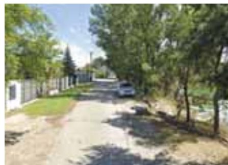
Vajnorské jazerá – zvyšovanie bezpečnosti lokality