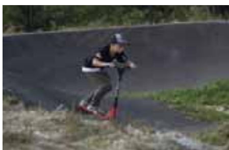
Ďalšia športová infraštruktúra pre mladých ľudí – Skatepark 2025