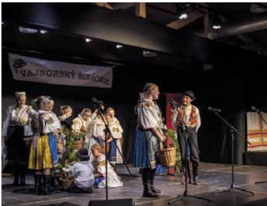
DFS Podobenka z Vajnora

Divadelné popoludnie pokračovalo Divadlom ENDORFÍN – interaktívnou rozprávkou Príbeh koníka Vraníka – príbehom o obyčajnom koníkovi, ktorý je zahrnutý láskou rodiny, ktorá sa o neho stará. Divadelný večer