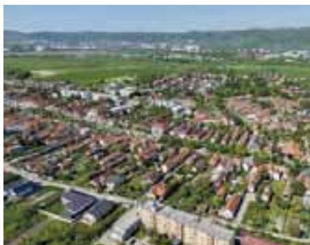
Regulovaný územný rozvoj – Nemecká dolina a Nové Štuty