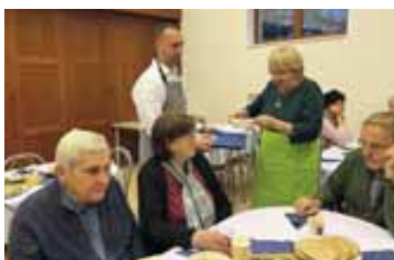
Programy pre seniorov – Zariadenie pre seniorov, kultúra, poznávanie, výlety, šport (petang)