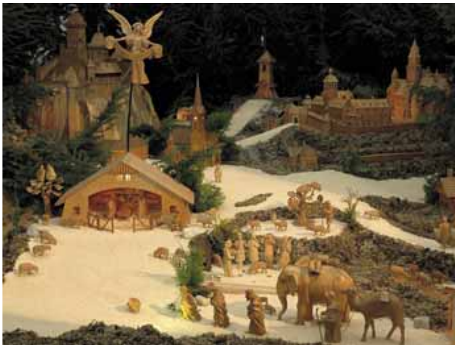
Betlehem v Mohelniciach, Česko

300 postáv, ktorých sa viac ako polovica pohybuje. Slávnostné verejné otvorenie tohto pozoruhodného diela sa uskutočnilo 26. novembra 1995, keď bola verejnosti sprístupnená prvá časť – oblasť Stredoslovenského kraja. Oblasť Západoslovenského kraja bola inštalovaná v novembri 1996 a o rok neskôr doplnením Východoslovenského kraja sa dielo skompletizovalo.