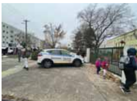
Posilnili sme prítomnosť mestských policajtov vo Vajnoroch