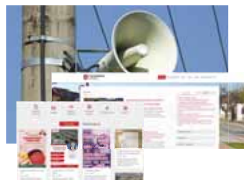
Transparentnosť a informovanie občanov prostredníctvom rôznych infokanálov