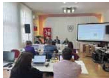
Pripravili sme Program hospodárskeho a sociálneho rozvoja mestskej časti do roku 2032