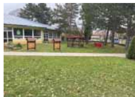
Životné prostredie – nové vodozadržné opatrenia v šiestich lokalitách – získali sme 625 tisíc Eur zo zdrojov EÚ