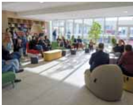
Skolaudovali sme prístavbu základnej školy vrátane športovísk, ktoré budú k dispozícii aj verejnosti