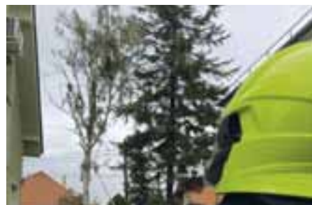
Bezpečnosť a poriadok – spolupráca s mestskou, štátnou políciou a DHZ Ivanka pri Dunaji, kamerové systémy